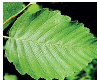
Une bonne façon de s'assurer de distinguer les deux essences est de faire du repérage lorsque les arbres ont encore leurs feuilles. Les feuilles de l'aulne crispé (à gauche) ont une forme plus arrondie que celles de l'aulne rugueux (à droite)