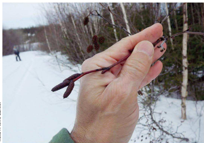
Le chaton mâle de l'aulne crispé donne le poivre des dunes. Attention! Ce chaton est semblable à celui de l'aulne rugueux. Pour bien identifier l'essence, mieux vaut regarder les bourgeons