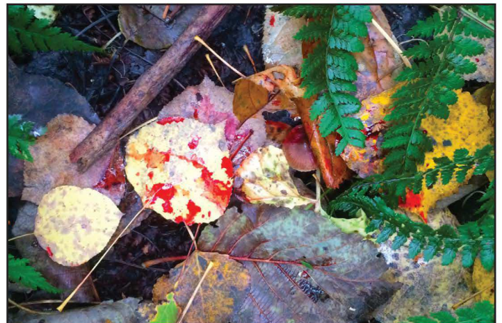
Les gouttes de sang sont l'un des indices à repérer lorsqu'on tente de retracer un gibier blessé

Les chasseurs le remarquent rarement, mais il est toujours possible de retrouver des poils là où se trouvait le gibier moment du tir. À coup sûr, en raison du diamètre de coupe de leurs lames de flèche, les arbalétriers et les archers auront une coupure de poils plus large qu'un chasseur à la carabine. Celui-ci retrouvera des poils au sol qui seront plus éparpillés. Rassemblés, ces poils sont précieux puisqu'ils confirment l'endroit touché, qu'il y ait du sang ou non. Sur le lieu de l'impact, ce n'est pas l'indice le plus flagrant, mais dans la suite de la recherche, c'est de première importance!